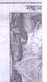
সন্ধান উপরের ছবিটি একটা ১৬/১১/২০১৭ তারিখের ছবি। এটি উত্তাপাড়া, ধান- ৭ গোছে। মৃত ব্যক্তির বছর, উচ্চতা ১৬৮ সেন্টিমিটার, রঙের ফুল হাতা পা জিনিস পাট। মৃত ব্যক্তির কারণে কোনও তত্বাহলে অনুগ্রহ করে স্পেশাল দুপারিনটে সি.আই.ডি. (পেবর কলকাতা- ৭০০০২৭ ২৪২০-৬১২০-তে)। আইসিই